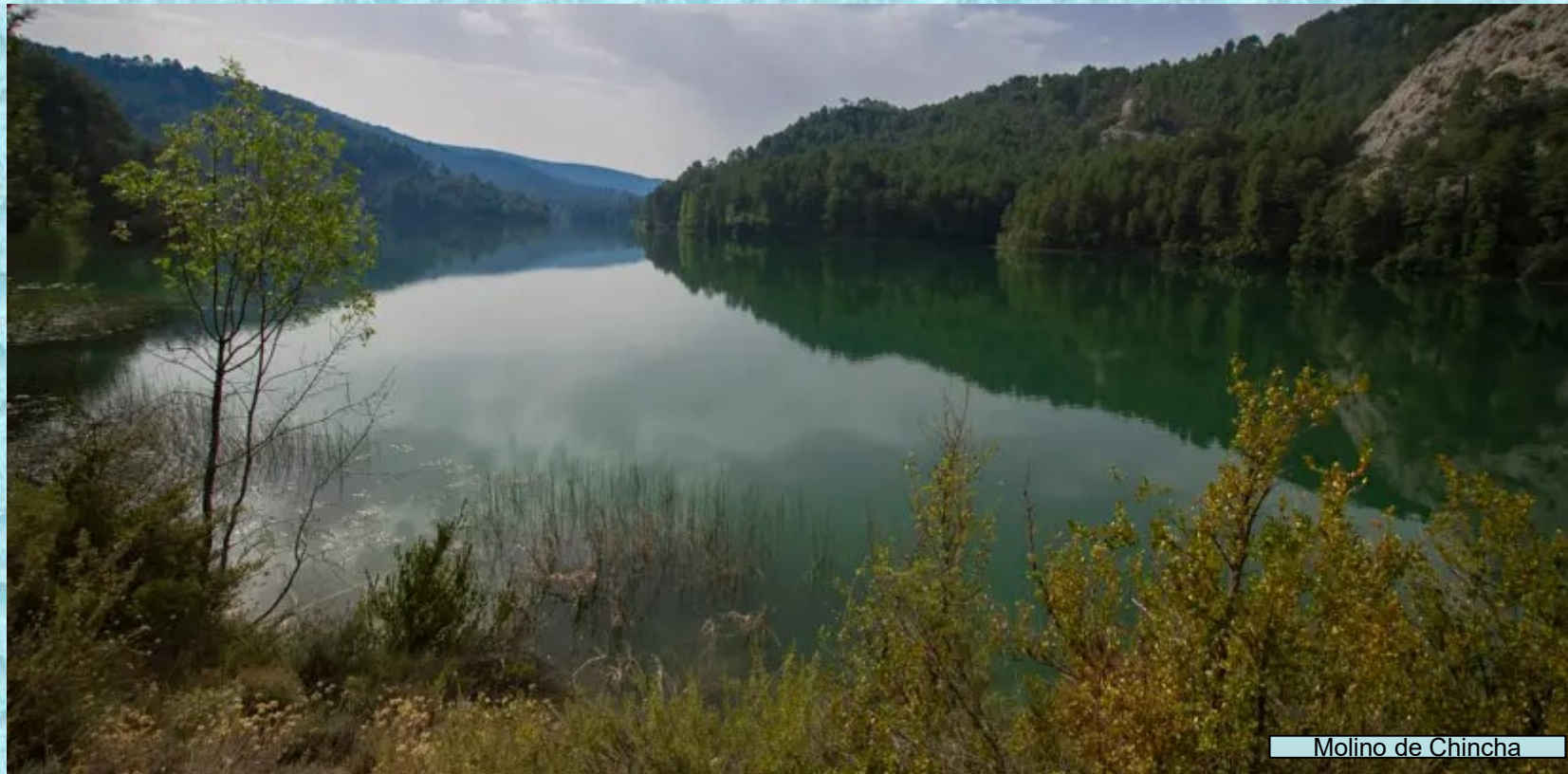
Molino de Chíncha